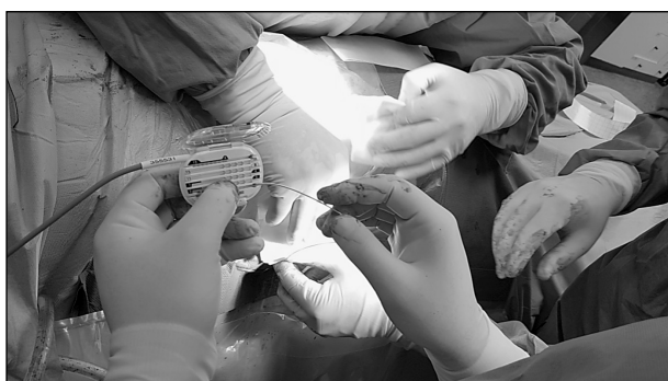
Sl. 2. Spajanje elektroda na privremeni stimulator kralježnične moždine

se javi fini osjet trnjenja u području u kojem bolesnik ima osjet boli. Na taj način bolesnik više neće osjećati bol u navedenom području već će imati osjet finog trnjenja koji ne smije biti neugodan. Elektrode se izvedu u području trbuha, te se spoje na kabel i privremenu bateriju preko koje bolesnik može pojačavati ili smanjivati stimulaciju, te ju po potrebi isključiti. Ako bi se privremeni perkutani stimulator kralježnične moždine pokazao učinkovitim, tada bi se nakon 4 tjedna ugradila trajna baterija za stimulator kralježnične moždine u području trbuha na koju bi se spojile elektrode koje su ranije postavljene u epiduralni prostor. Rad baterije, kao i stimulacija pojedinih dijelova elektrode, može se programirati za svakog bolesnika drugačije, ovisno o mjestu na kojem bolesnik osjeća bolove.