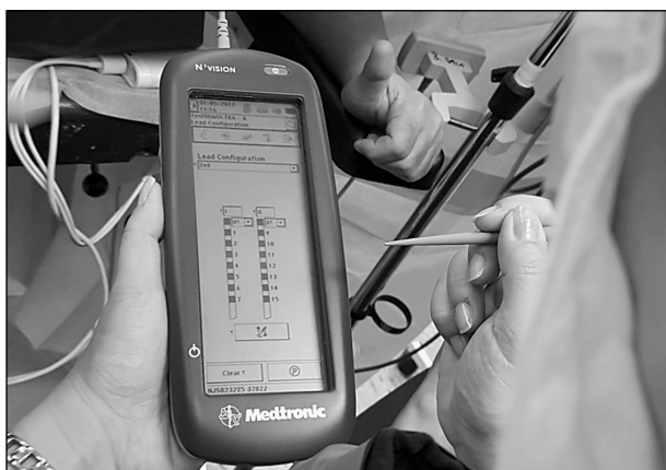
Sl. 3. Programiranje privremenog nervnog stimulatora kralježnične moždine uz budnog bolesnika na kirurškom stolu