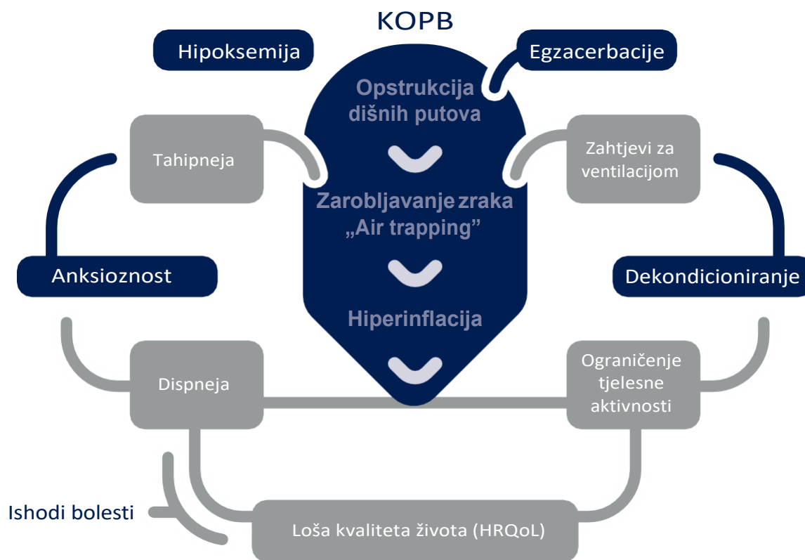
SLIKA 2. Povezanost patofizioloških procesa i simptoma sa smanjenjem kvalitete života

Prilagođeno prema: Cooper Am J Med; 2008;121:S33-S45