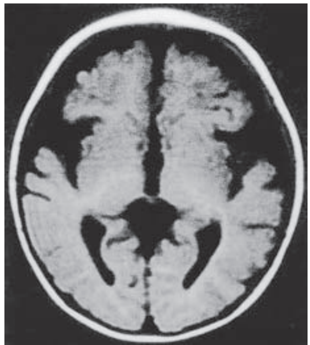
Slika 3. Magnetska rezonancija mozga djeteta koje boluje od nutritivnog manjka vitamina B 12 . Značajna kortikalna atrofija u bolesnika 3, iz tablice 1.

Prema literaturi postoji nekoliko definicija prema kojima se na temelju laboratorijskih nalaza i/ili kliničke slike postavlja dijagnoza manjka vitamina B 12 , te još uvijek ne