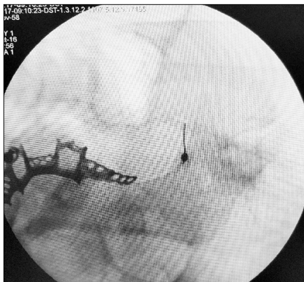
Sl. 2. Igla usmjerena prema foramenu ovale, submentalni pogled (autorska fotografija uz suglasnost bolesnice)