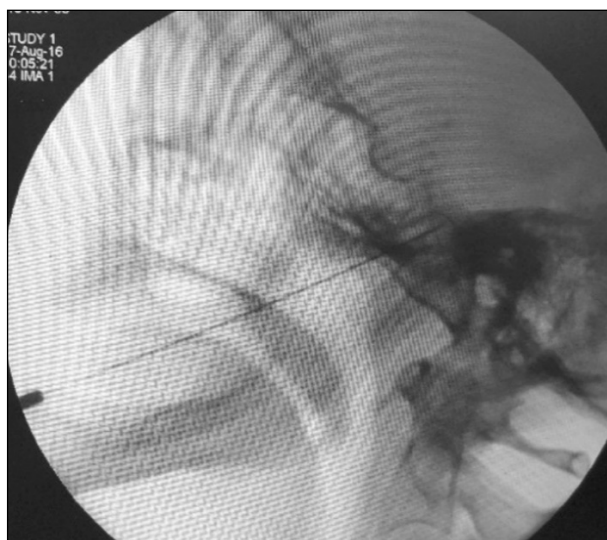
Sl.3. Lateralni pogled