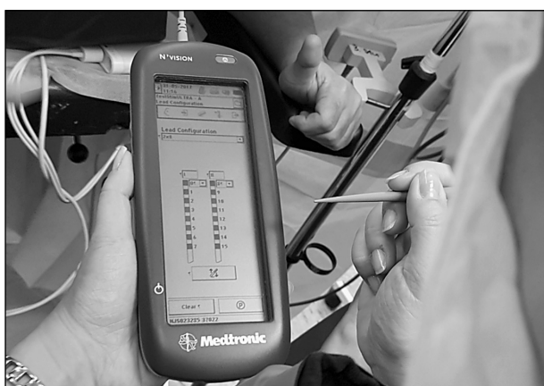
Sl. 3. Programiranje privremenog nervnog stimulatora kralježnične moždine uz budnog bolesnika na kirurškom stolu