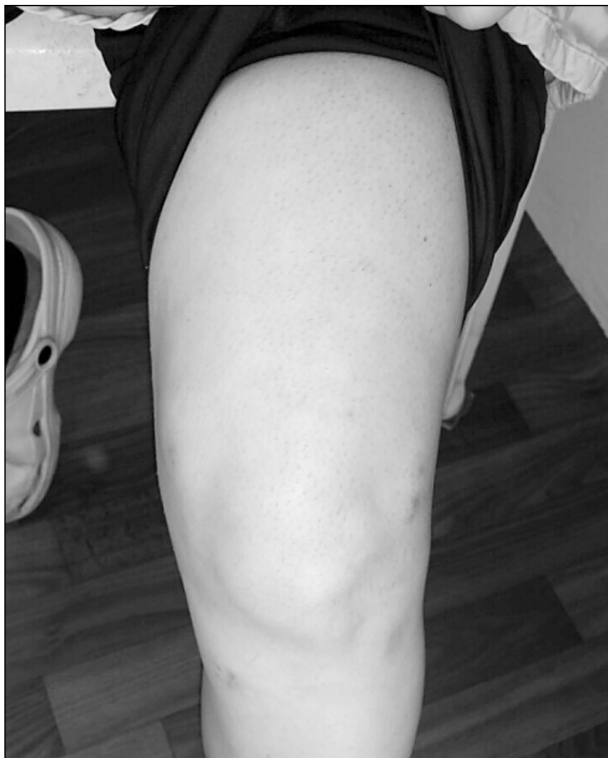
Sl. 2. Promjene u obliku crvenila i svrbeža na mjestima uboda nakon radiofrekvencijske denervacije genikularnih živaca (fotografirala dr. Marica Kristić, uz dozvolu bolesnice).

Nakon izvedenog postupka RF denervacije genikularnih živaca kod 88 bolesnika u Zavodu za liječenje boli KBC-a Osijek, kod jednog su bolesnika zabilježene promjene na mjestima uboda u obliku crvenila i svrbeža (sl. 2), koje su se spontano povukle unutar nekoliko dana, te kod jednog bolesnika promjene na koži duž cijele noge poput opekline, koje su se uz konzervativno liječenje povukle unutar mjesec dana.